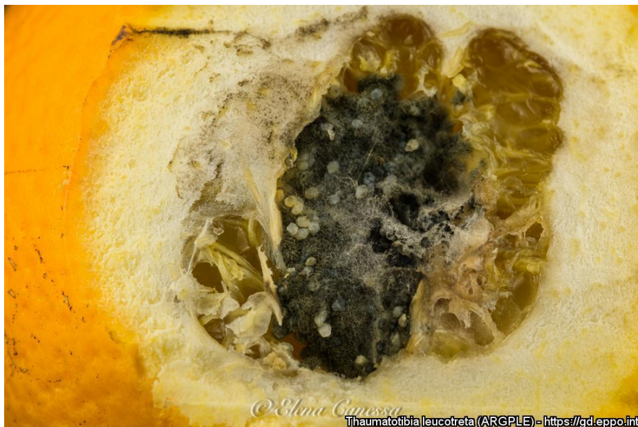
Thaumatotibia leucotreta (ARGPLE) - https://gd.eppo.int

Prítomnosť Thaumatotibia leucotreta na kvetoch ruže (Zdroj: https://gd.eppo.int/taxon/ARGPLE/photos# )