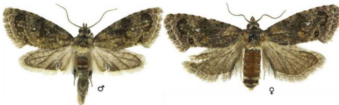
Dospelý samček (vľavo) a samička (vpravo) Thaumatotibia leucotreta .