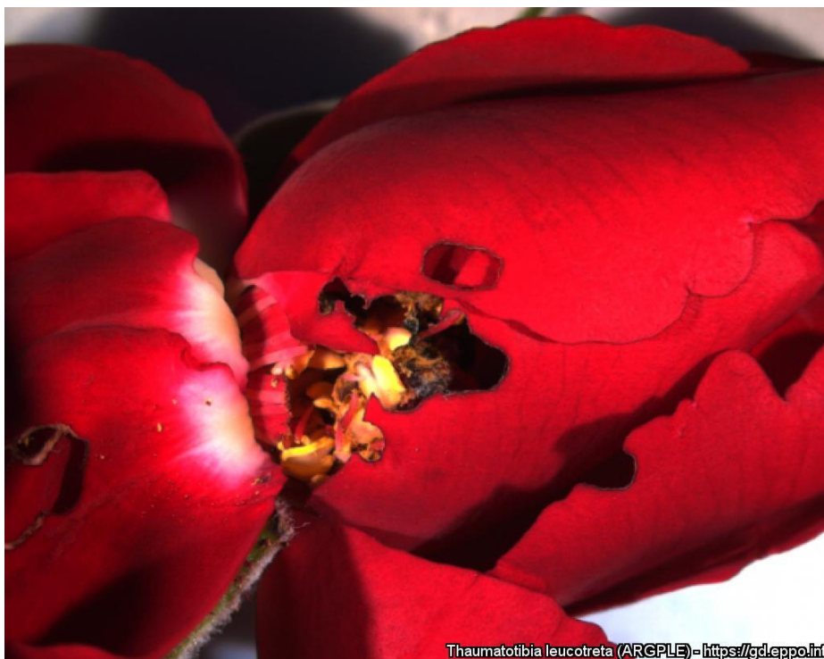
Thaumatotibia leucotreta (ARGPLE) - https://gd.eppo.int

Prítomnosť Thaumatotibia leucotreta na kvetoch ruže (Zdroj: https://gd.eppo.int/taxon/ARGPLE/photos# )