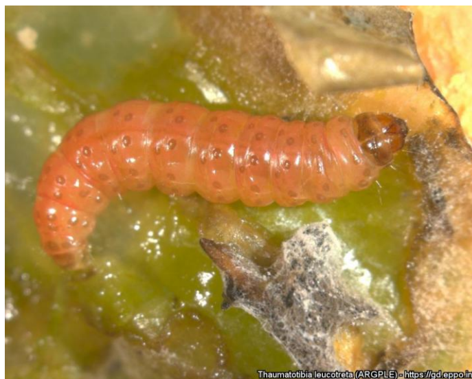
Larva Thaumatotibia leucotreta