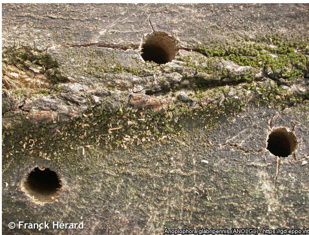
Výletové otvory