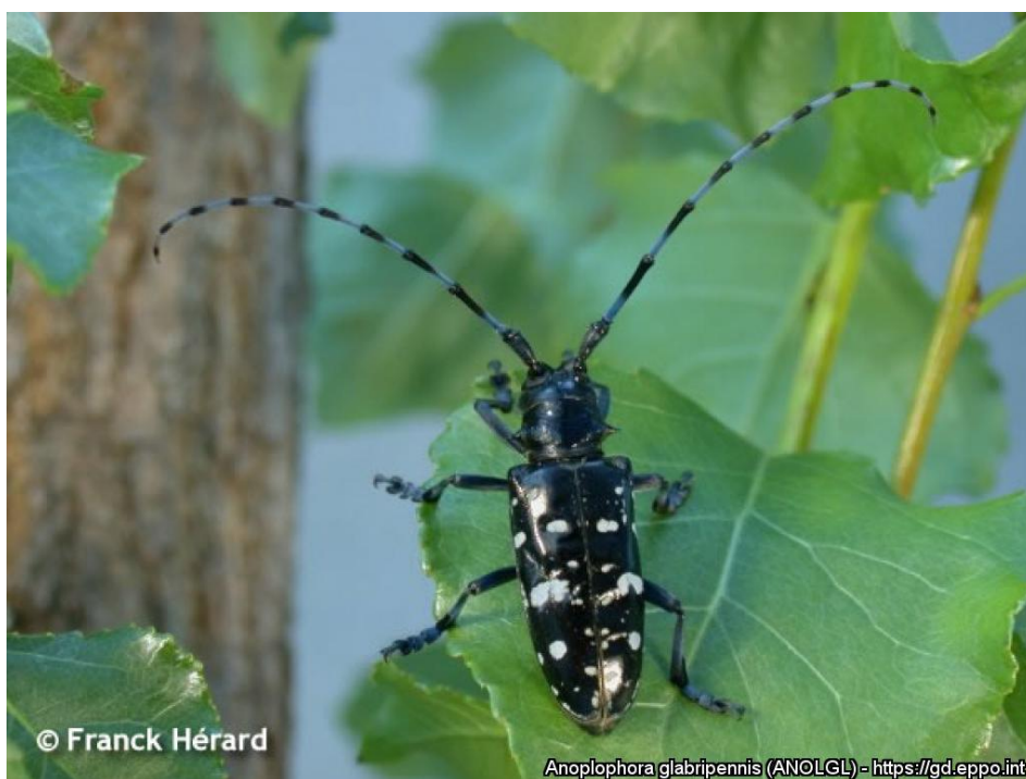
Dospelý jedinec Anoplophora glabripennis