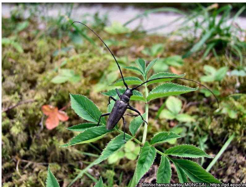
Vektor Monochamus sartor