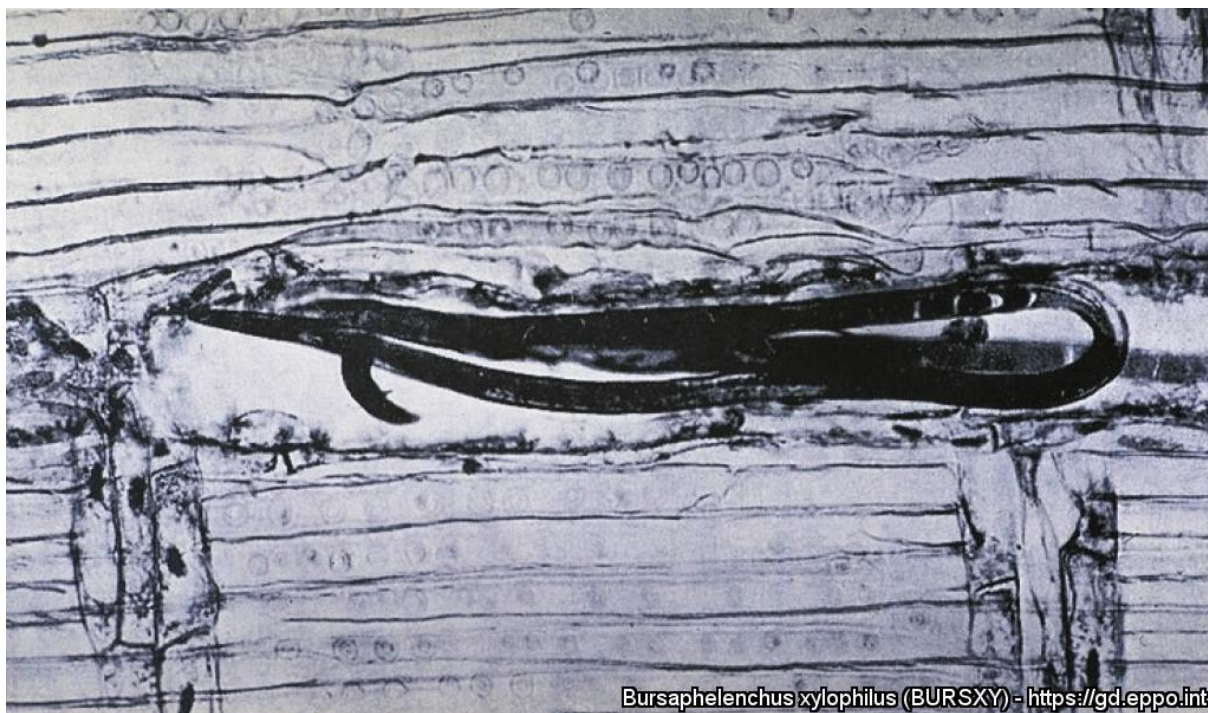
Bursaphelenchus xylophilus (BURSXY) - https://gd.eppo.int