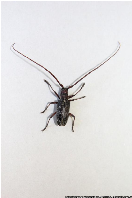
Vektor Monochamus galloprovincialis