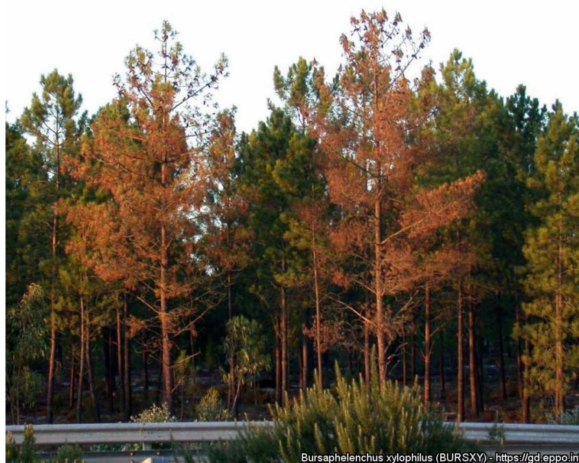
Bursaphelenchus xylophilus (BURSXY) - https://gd.eppo.int

(Zdroj: https://gd.eppo.int/taxon/BURSXY/photos )