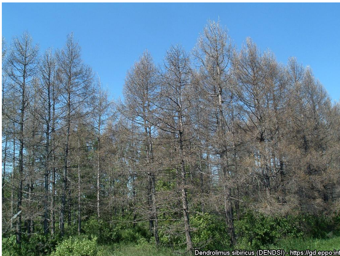
Dendrolimus sibiricus (DENDSI) - https://gd.eppo.int