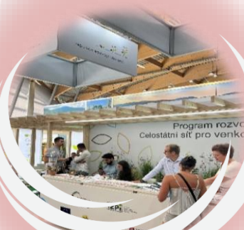
Národná a nadnárodná spolupráca