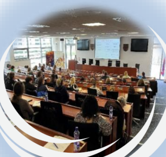
Vzdelávacie a informačné aktivity