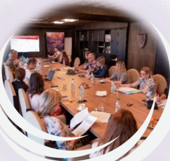
Zber a poskytovanie informácií