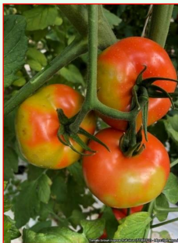
Príznamy ToBRFV - mramorovanie a odfarbenie rajčiakov