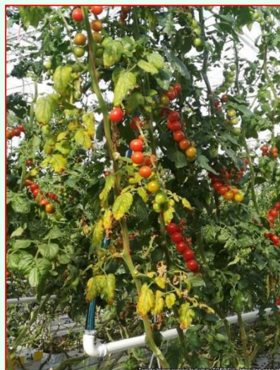
Príznamy vädnutia a odumierania v skleníkových podmienkach