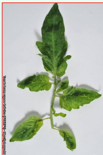
Listová mozaika na rajčiaku