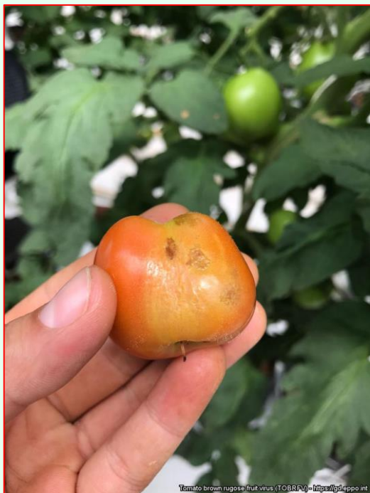
Znehodnotený plod rajčiaka vírusom ToBRFV

ToBRFV má typické štruktúrne a molekulárne vlastnosti tobamovírusu. Genóm je tvorený jednou molekulou RNA. ToBRFV môže prirodzene infikovať systémovo rajčiak a papriku. Vírusové častice tobamovírusov sú mimoriadne stabilné a ľahko sa mechanicky prenášajú z jednej rastliny na ďalšiu rastlinu prostredníctvom bežných kultúrnych praktík (napr. ruky pracovníka, odev, náradie) a cirkulujúcou vodou (napr. v prípade hydroponických rastlín rajčiaka). Infekčnosť tobamovírusov je zachovaná v semenách až niekoľko rokov. Väčšina tobamovírusov vykazuje veľmi nízke percento prenosu zo semena na semeno alebo vôbec žiadny prenos. Mechanický prenos ToBRFV je však možný prostredníctvom čmeliakov ( Bombus terrestris ). ToBRFV kontaminuje obal semena hostiteľskej rastliny. Pohyb tobamovírusov z bunky do bunky v rastlinách prebieha prostredníctvom plazmodezmy a je podporovaný proteínom vírusu. Pohyb na väčšiu vzdialenosť v rámci rastlinných hostiteľov prebieha cez floém a vyžaduje si vírusovú replikáciu. Tobamovírusy nemajú žiadne známe prirodzené vektory.