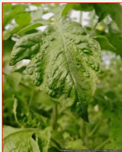
Pľuzgier na listoch rajčiaka