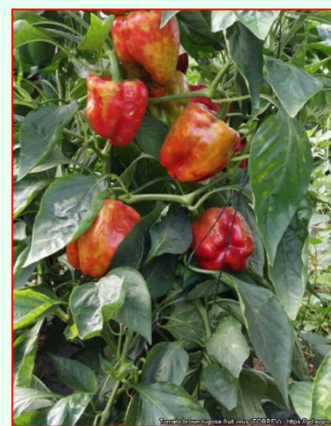
Príznamy ToBRFV na plodoch papriky