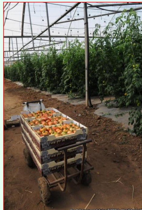
Infikované plody rajčiakov vírusom ToBRFV v skleníku