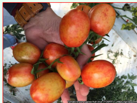
Príznačky ToBRFV na rajčiakoch

Vírus Tomato brown rugose fruit virus patrí medzi ostatných karanténnych škodcov Únie. Dôležitá je dezinfekcia použitých nádob, podnosov, nástrojov, aby sa zabránilo vstupu ToBRFV do miest, kde sa pestujú hostiteľské rastliny. Dôležité je aj používanie zdravého výsadbového materiálu. Eradikácia je možná len vtedy, ak sa ohnisko zistí včas a prijmú sa prísne opatrenia. Na diagnostický rozbor sa odoberá celá rastlina s podozrivými listami a plodmi bez pôdy, teda bez koreňov a kvetnáčov.