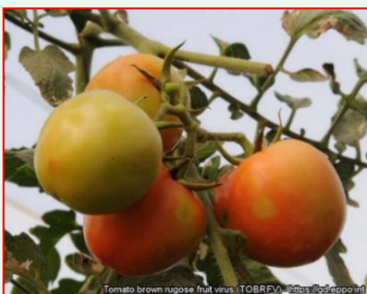
Chlorotické škvrny na plodoch rajčiaka