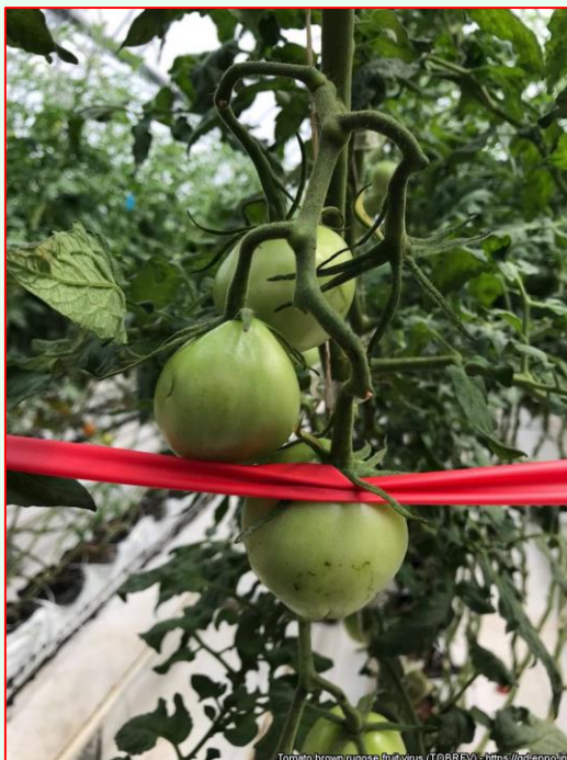
Deformované plody rajčiaka vírusom ToBRFV