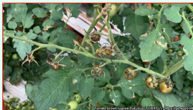
Nekróza sepalov, stonky na rajčiaku